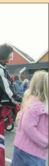
...e fekk helse på